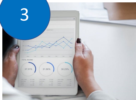
Scale EuroPACE across Europe

Facilitate and support 4 Leader Cities/ Regions to set up EuroPACE programs.