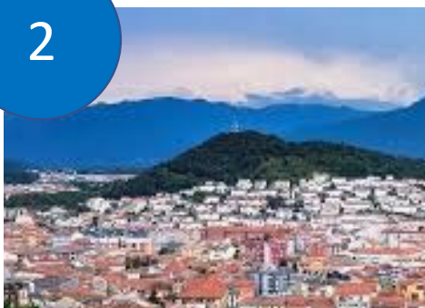
Deploy EuroPACE in Spain

Design and run the first residential EuroPACE pilot in the city of Olot, Spain.