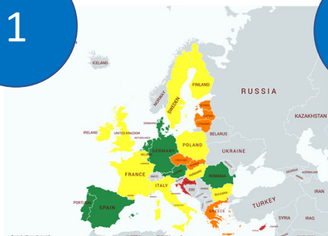
Assess Market Readiness

Conduct market analysis and identify EuroPACE-ready countries Report can be downloaded on: www.europace2020.eu